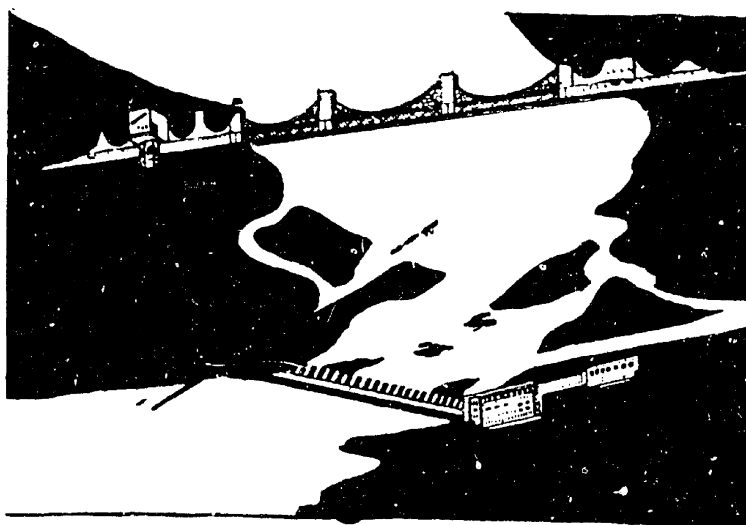
דאָ וועט זײַן די עלעקטראַסטאנציע.

ערשטע קלאַץ, האָבן די כאוויירים זײַנע אונטערגעכאפט, און מיט „הורא“-געשרײַען האָבן זיי אים גענומען הייבן אינדערלופטן. די ארבעטער האָבן געפילט, אז דאָ ווערט איצט געבוירן די מעכטיקע צוקונפט פון אוקראינע, און פון יענער צײַט אָן הערט נישט אויף דער ארבעט-גערויש איבערן דניעפער. טאָגן ווי נאכט גײַט דאָ די ארבעט. דעם 1טן דעקאבער 1932 וועט דער דניע-פערבוי שוין נעמען טרײַבן די גאַלדענע ענערגיע.